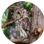
幸福を運ぶ フクロウ

〒豊田市岩倉町一本松 1-1 ☎0565-58-2736 📧mail@toyotanomori.jp 🕒月~金曜(祝日含む)9:00 ~ 16:30※入場は16:00まで 📅土・日曜日のほかGW、お盆、年末年始 長期休館日有り 🚗乗用車 20台、バス要相談 📍愛知環状鉄道「三河豊田駅」から車で15分 🌐 https://www.toyota.co.jp/jpn/sustainability/social_contribution/feature/forest/ ※事前予約要