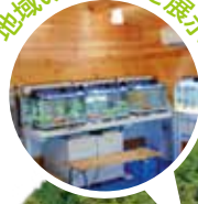
地域の魚たちを展示