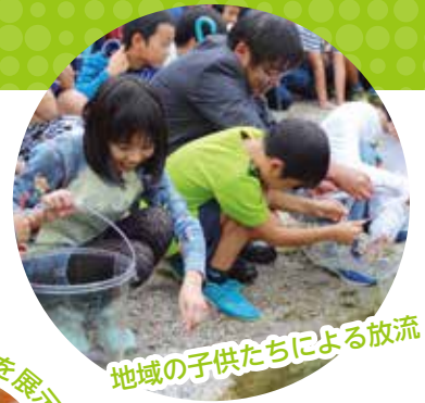
地域の子供たちによる放流