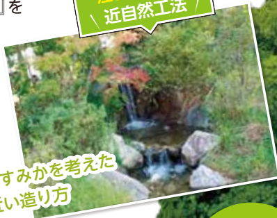
生き物のすみかを考えた自然に近い造り方