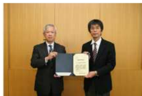
サンコール(株)広瀬工場