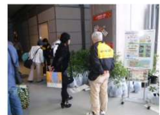
どんぐりプロジェクト