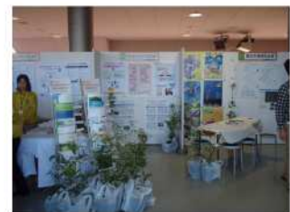
協定協議会ブース

また、ブースの一部では、住友ゴム工業(株)のどんぐりプロジェクトの PR としてどんぐりの苗木を来場の方々に配布しました。