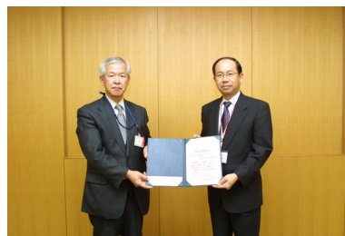
アイシン精機株式会社 藤岡試験場