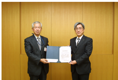
アイシン化工株式会社

協定締結事業者は、公害防止協定からの改定締結事業者が中心ですが、今回締結した3 者は、公害防止協定を締結していない、新規締結事業者です。