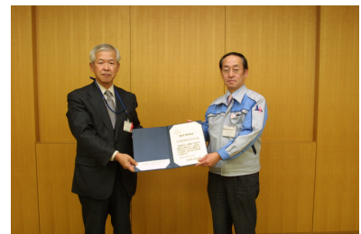
大豊精機株式会社